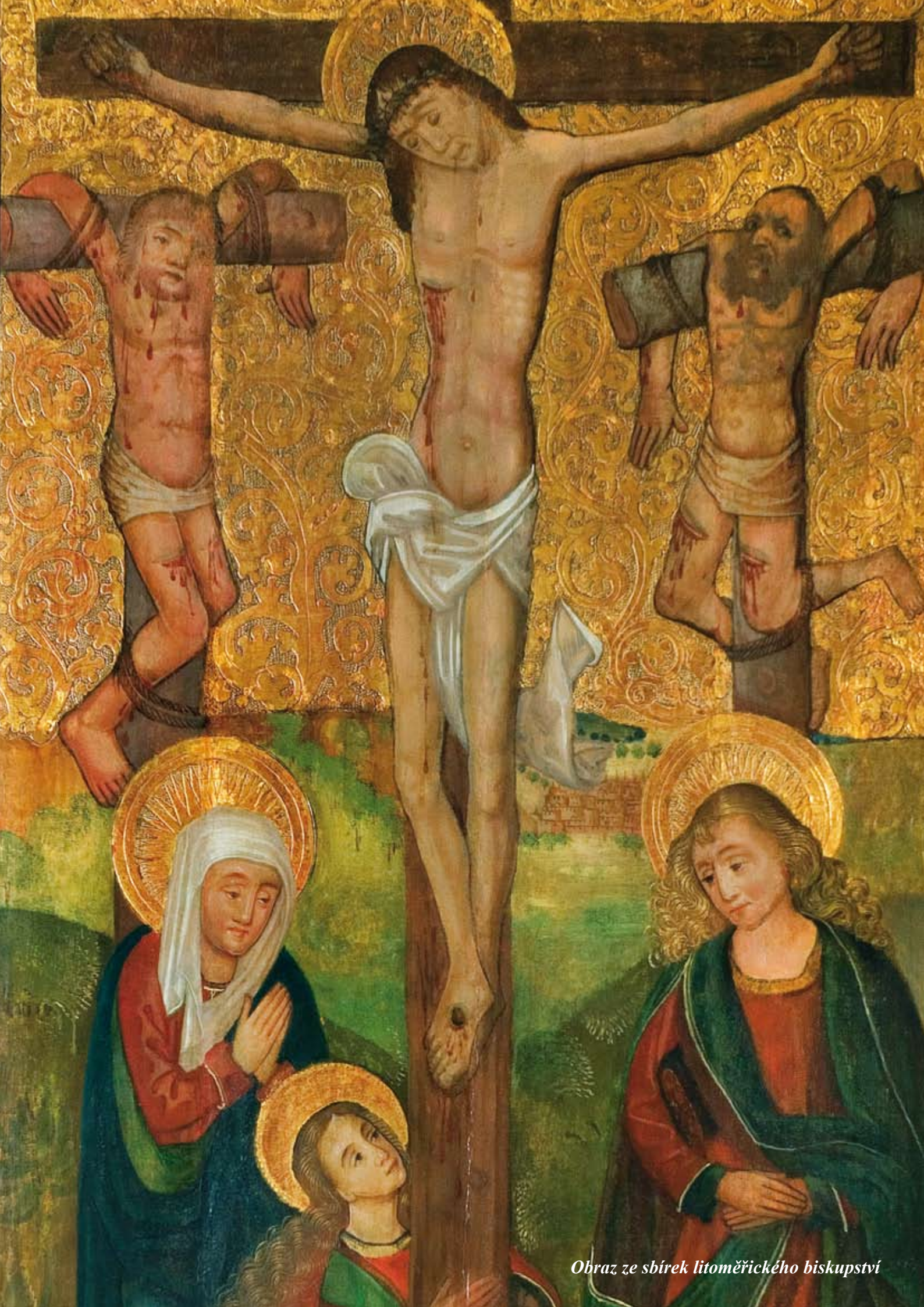
Obraz ze sbírek litoměřického biskupství